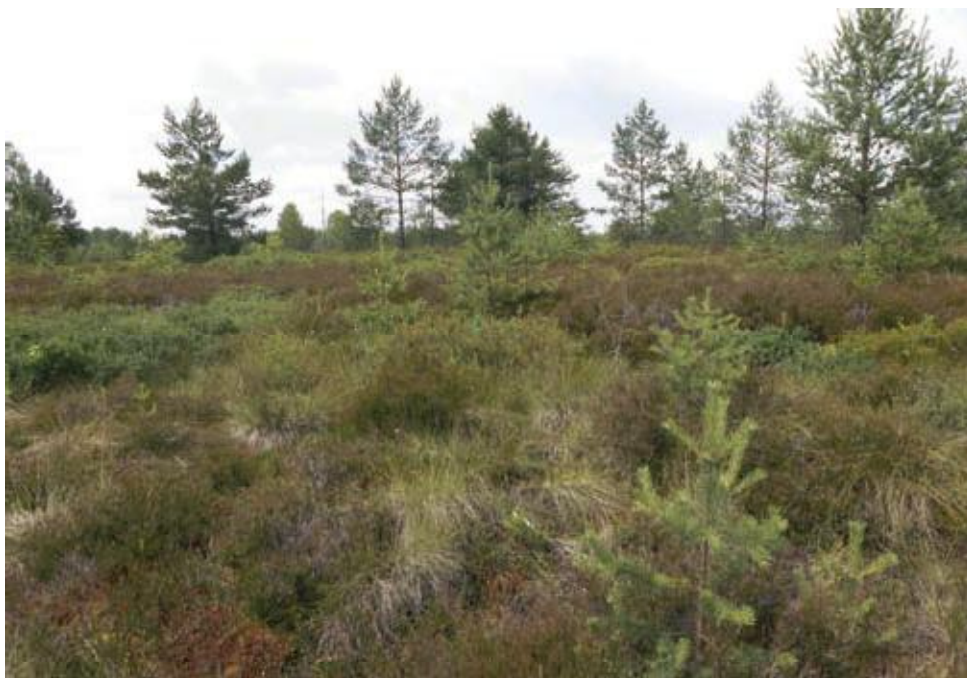
Fot. 1. Dawna powierzchnia poeksploatacyjna na torfowisku Baligówka w Kotlinie Orawsko-Nowotarskiej.