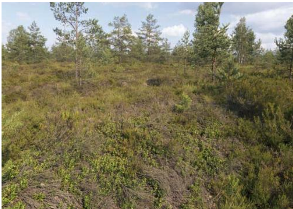
Fot. 2. Dawna powierzchnia poeksploatacyjna na torfowisku Puścizna Wielka w Kotlinie Orawsko-Nowotarskiej.