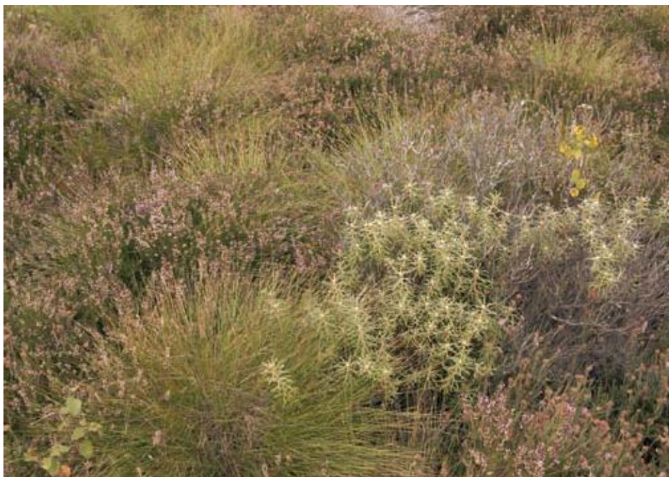
Fot. 3. Powierzchnia zdegradowanego torfowiska z welfianką pochwowatą, bagnem zwyczajnym, wrzosem i wrzosem bagiennym w obszarze natura 2000 „Bagna Izbickie”