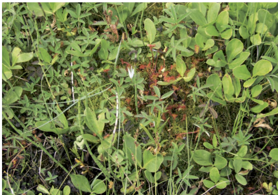
Fot. 4. Siedmiopalecznik błotny Comarum palustre i bobrek trójlistkowy Menyanthes trifoliata na torfowisku przejściowym Zapadź koło Oświęcimia.

Torfowiska przejściowe i trzęsawiska są częste w północnej części Polski, zwłaszcza na obszarach sandrowych (Herbichowa 2004); w części centralnej zdecydowanie rzadsze. Na południu kraju występują w rozproszeniu, przede wszystkim w Sudetach. W regionie