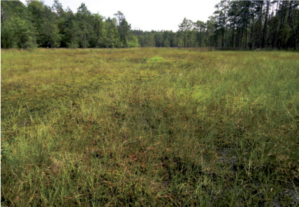
Fot. 1. Torfowisko przejściowe w Puszczy Solskiej wykształcone w miejscu wypłyconego zbiornika dystroficznego.