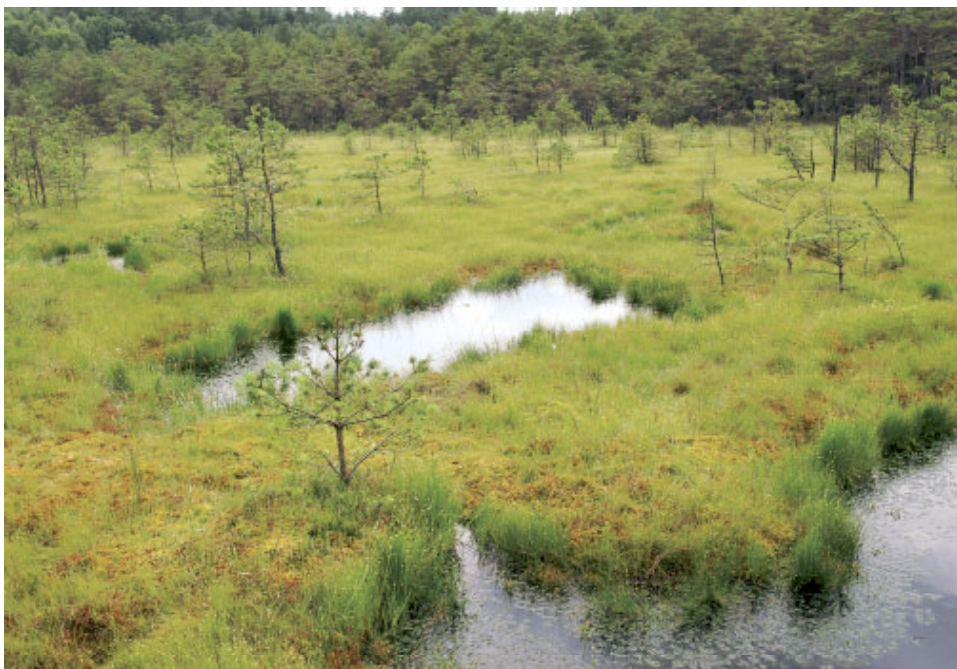
Fot. 2. Płó nasuwające się na Jezioro Leniwe w obszarze Natura 2000 Pływające Wyspy pod Rekowem.

Systematyka zbiorowisk roślinnych torfowisk przejściowych i trzęsawisk nie jest jeszcze do końca poznana. Podane wyżej zbiorowiska (wg Matuszkiewicza 2001) nie przedstawiają pełnego zróżnicowania tych siedlisk. Należy tu jeszcze uwzględnić takie asocjacje, jak: Eriophoro angustifolii-Sphagnetum recurvii , Sphagno-Caricetum rostratae , Junco filiformis-Sphagnetum recurvii , Calamagrostietum neglectae , Carici echinatae-Sphagnetum , zbiorowisko z Calla palustris , zbiorowisko z Comarum palustre (Herbichowa 2004), a także zbiorowisko Eriophorum vaginatum-Sphagnum fallax (zaliczane do klasy Oxycocco-Sphagnetea ) i zapewne jeszcze inne. Konieczne są dalsze badania fitosocjologiczne na siedlisku 7140 i ponowne uaktualnienie ich systematyki w świetle nowych danych.