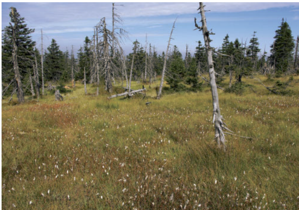
Fot. 3. Torfowisko przejściowe w obszarze źródłiskowym zlewni Kamieńczyka w Karkonoszach.